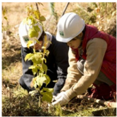
ウリハダカエデの植樹

秩父地域は、その面積の87%を山林が占めています、一部に原生林の姿を残しつつも、半分近くはスギやヒノキなどの人工林で占められています。森を活用しながら、いろいろな生き物が生きていける本来の姿を取り戻していきたいと活動をはじめました。森で種を採取し苗を育て、そして植樹、下草刈りを行い大切に育てています、20年以上たってようやく森らしくなります。長い時間と手間のかかる私たちの活動は多くの皆様から寄せられるご支援・ご協力によって支えられています。これからも続く、未来へつなぐ森づくり・苗づくりを、どうぞ応援してください。