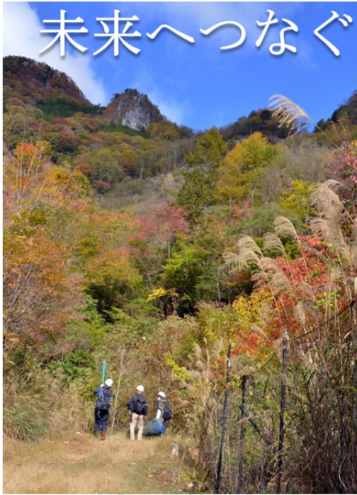
埼玉県有林山吹沢植栽地

秩父地域は、その面積の87%を山林が占めています、一部に原生林の姿を残しつつも、半分近くはスギやヒノキなどの人工林で占められています。森を活用しながら、いろいろな生き物が生きていける本来の姿を取り戻していきたいと活動をはじめました。森で種を採取し苗を育て、そして植樹、下草刈りを行い大切に育てています、20年以上たってようやく森らしくなります。長い時間と手間のかかる私たちの活動は多くの皆様から寄せられるご支援・ご協力によって支えられています。これからも続く、未来へつなぐ森づくり・苗づくりを、どうぞ応援してください。