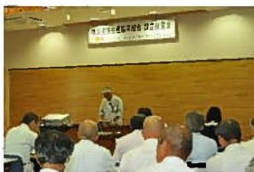
左 秩父樹液生産協同組合設立発表会、右 試食会