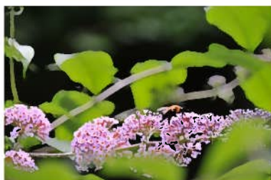
フサフジウツギ (房藤空木)