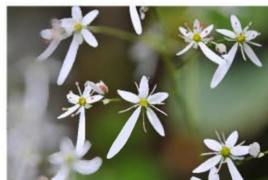
ダイヤモンドソウ (大文字草)