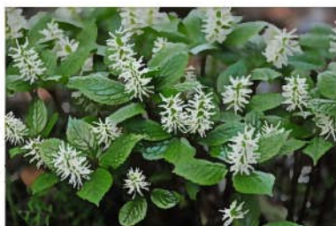
ヒトリシズカ (一人静)