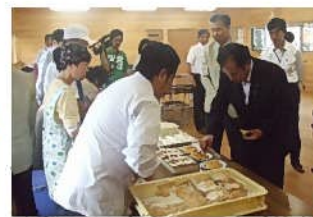
カエデ樹液使用商品を試食