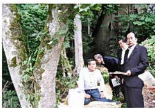
上田知事へ樹液採取作業を説明