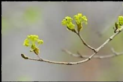
イタヤカエデ開花 (4.15 撮影)