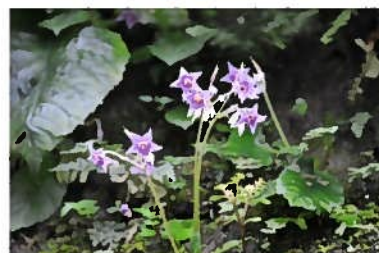
イワタバコ (岩煙草)