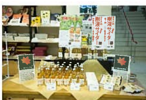
店頭と並ぶカエデ樹液商品