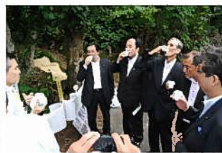
カエデ樹液(原液)を試飲