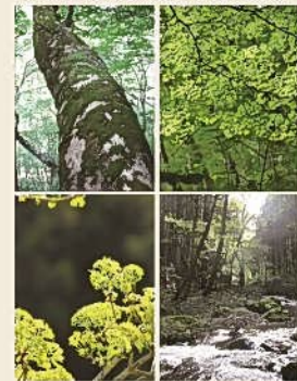
秩父樹液生産協同組合 NPO 法人 秩父百年の森