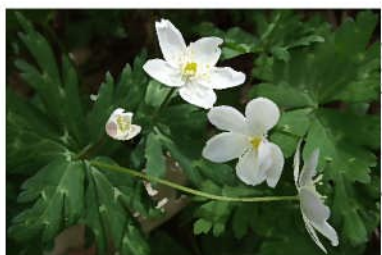
ニリンソウ (二輪草)